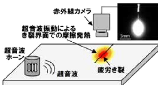
超音波加振赤外線サーモグラフィ法(Sonic-IR法)の概要と検査結果